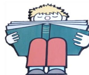
BIBLIOTHEQUE PIERRE BICHET OYE ET PALLET